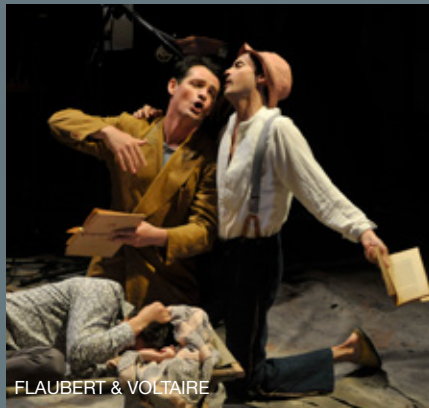
FLAUBERT & VOLTAIRE