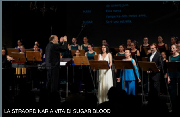
LA STRAORDINARIA VITA DI SUGAR BLOOD