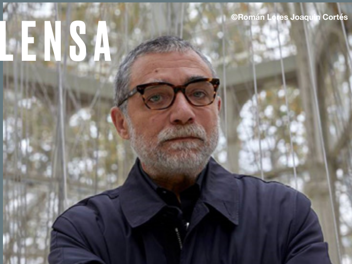
Joaquín Cortés

Jaume Plensa va ser l'autor del cartell del Festival de l'edició 2000 dedicat a Johann Sebastian Bach.